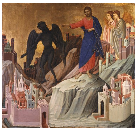
Jesus fristen av djevelen. Tekst på 1. søndag i faste