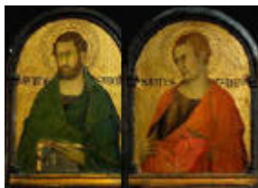
St. Simon og St. Judas